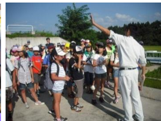
遊水地見学（協議会長他）