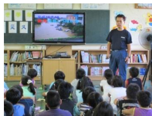
7・13水害の話（地域の方）