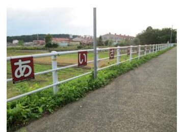
登校班で取り組むあいさつ運動