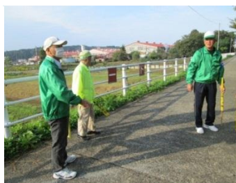
草薙応援団名木野っ子見守り隊