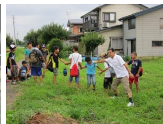
地域散策（地域の方）

体験を通して、子どもたちは、水害が起きた時の行動の仕方や留意点を、地域の実態に即して学ぶことができました。