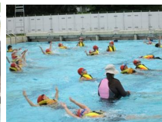
スローロープ体験（RAC）