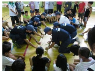
搬送訓練（見附消防署）

参加した地域ボランティアの方からは、「防災スクールはとてもいい取組ですね。来年も協力します。」「作った豚汁を子どもたちに喜んでもらってよかったです。」などの声が寄せられました。ボランティアの方にとっても達成感のある活動となりました。