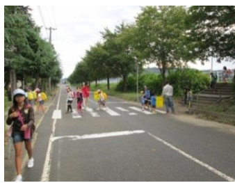
育伸会四役の街頭指導

取組は始まったばかりですが、見附市共通保護者アンケートでは、6月と12月の結果を比較し、家庭でのあいさつで約2%、お手伝いで約7%の伸びがありました。今後一層活動を進め、成果をあげていきます。