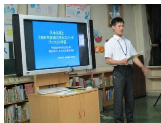
ハザードマップの学習（市職員）