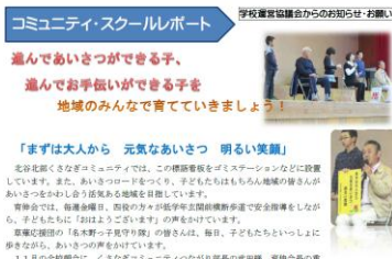
コミュニティ・スクールレポート