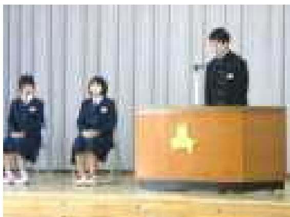
始業式(代表生徒の決意、抱負発表)

平成31年度は、1年生54名、2年生68名、3年生77名、計199名。学級数は、1年生2学級、2年生2学級、3年生3学級、特別支援学級2学級の計9学級です。