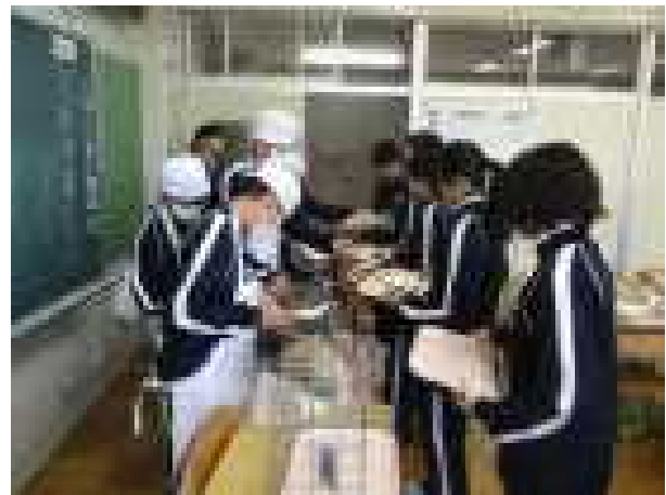
1年生、入学式直後の学級開き(左)と給食準備(右)のようす

見附市教育委員会発行の「みつけ塾」の中に、「一般的な和食の作法」があります。1部抜粋します。日本人として知っておきたいものです。