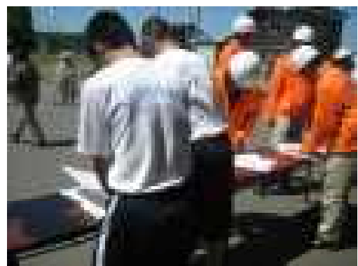
昨年度の防災訓練の様子

今年度の生徒同士と担当教師の顔合わせと名簿作成を行なうとともに、地区内の危険箇所を確認し、安全マップを作成しました。また、南中では、分団と各区の区長さんとの連絡係でもある地域親善大使制度を設けており、地域貢献活動、見附市防災訓練中学生ボランティアの参加者や活動の内容のやりとりをします。この地域親善大使の生徒、5月23日(木)の地域貢献活動、6月9日(日)の見附市防災訓練中学生ボランティアに積極的に参加することなどを確認しました。