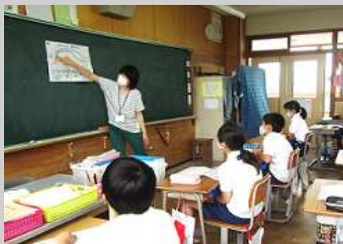
7.9 6年 食育 栄養教諭が「成長期の食生活」について講話。真剣に聞いていました。