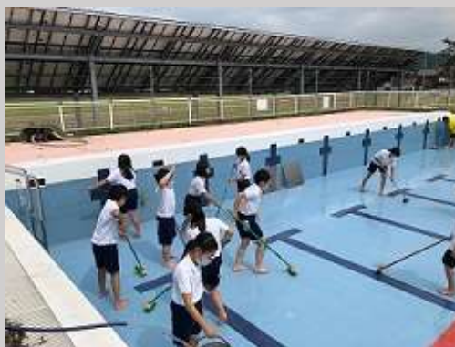
7.22 5年 梅雨の晴れ間にプール掃除 今年はいれませんが来年のためにがんばりました。