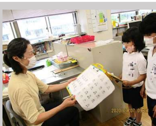
7.8 1年生「せんせいとなかよし」 ときどきしながら教室に入り自己紹介しました。

8月初旬の個別懇談会では、短いながらも時間を増やしましたので、お子さんの学校での様子をお伝えするとともに、保護者の皆様のお気持ちもご遠慮なくお知らせくださいますようお願いいたします。(懇談時間は、昨年10分→今年は15分。わずか5分ですが五割り増しです。)