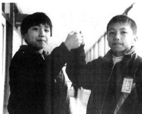
広報見附 1993.3 No. 391 から

創立 150 周年記念に向けて伝統教室を整備する事業を進めています。その一環として、「広報見附」創刊 60 年の中で取材された見附小学校の記事をパネルにして展示したり、見附小学校出身の方を取材して、思い出や今の見附小学校の子どもたちにメッセージを語ってもらったりしています。現在の、そして未来の見小っ子にも、伝統教室に来ればいつでも見られるように整備することを目標に資料の整理をしています。以下に一部を紹介します。