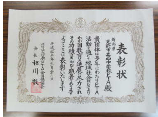
日本PTA全国協議会表彰

今後も、地域で子どもを健やかに育む主導的な役割を果たす団体として、ますますの活動の活性化が期待されます。