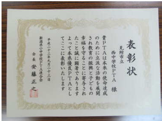
新潟県小中学校PTA連合会表彰

このたび、西中学校PTAが「日本PTA全国協議会」から表彰されました。これまでの主体的な活動や学校と一体となった取組実績が評価されたものです。併せて、「新潟県小中学校PTA連合会」からも表彰いただいています。これまで西中学校のPTA活動をリードされてきた歴代の会長様はじめ、役員、会員の皆様の活動のたまものと思います。