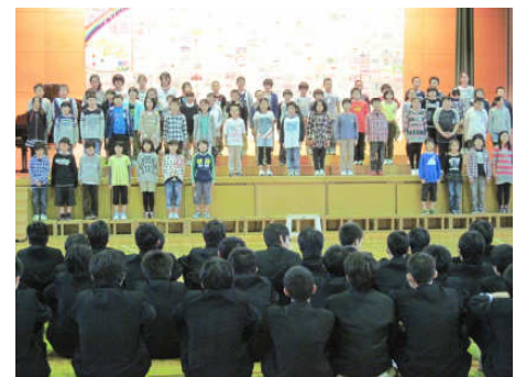
葛巻小5年生の古典の発表

3年生全員が葛巻小学校に出かけ、合唱コンクールで発表した曲を、5・6年生に聞いてもらう機会を設けました。学年合唱曲「流浪の民」を歌う姿に、小学生も大変感心して聴いていました。その後、葛巻小学校5年生の古典の発表を聞かせていただいたり、4組の生徒と5年生が交流の機会を持ち、「むかでリレー」や「ボール転がし」などのレクリエーションで、一緒に汗を流し、楽しみました。最後に4組の合唱を聴いてもらい有意義なひとときを過ごしました。