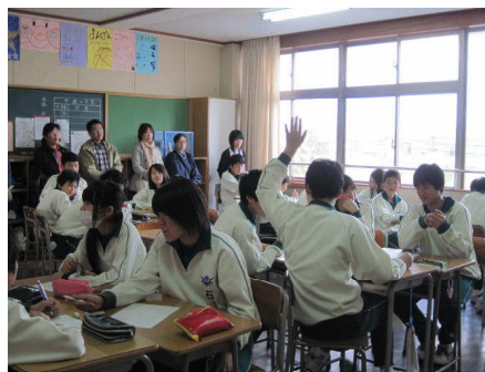
参観日：道徳の授業風景

また、授業での規律を守ることを重視し指導に力を入れていきます。落ち着いた雰囲気の中で、自らの考えを持ち、自信を持って発言をしていくことや意見を交わしていくことができるよう指導に努めています。