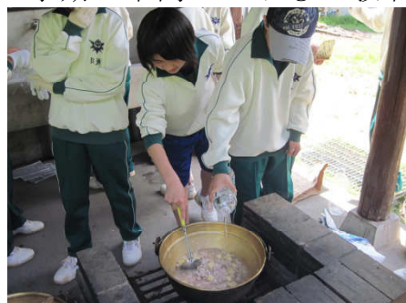
1年生：力合わせて野外炊飯

新年度が始まり2ヶ月が経とうとしています。1年生もすっかり中学の生活やリズムに慣れてきたように感じています。1学期の中間テストも2教科のみでしたが行われ、どの生徒も真剣に取り組んでいました。26日には、大平森林公園と市総合体育館を使って野外炊飯と集団づくりのためのアドベンチャープログラムに取り組みました。