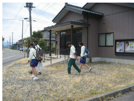
2年生：グループでウォークラリー

これまでの様子を見ると、生徒一人ひとりが自らの夢や希望に向かって、良いスタートを切ってくれたものと思います。いよいよ6月。学習の充実はもとより、部活動では市内大会を始めとして各種大会があるなど、充実した活動を行う時期となります。一人一人の生徒が「感動 西中」の実現に向けて、仲間同士が支え合い、活発に活動を進めてくれるよう願っています。