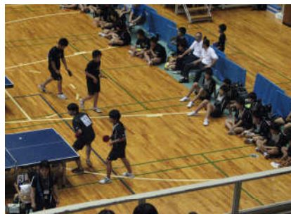
<卓球> 新潟市 東総合スポーツ センター