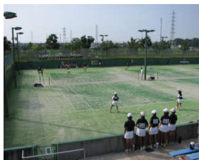
<ソフトテニス> 新潟市庭球場