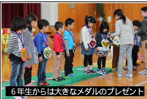
6年生からは大きなメダルプレゼント