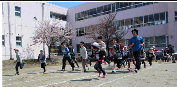
全学年入り交じってのスタート

4月は、学校一周マラソンの後に短距離走です。職員は完走をめざし、下学年は上級生を追い越そうと、上級生は負けまいと、競争を楽しみながら取り組んでいます。