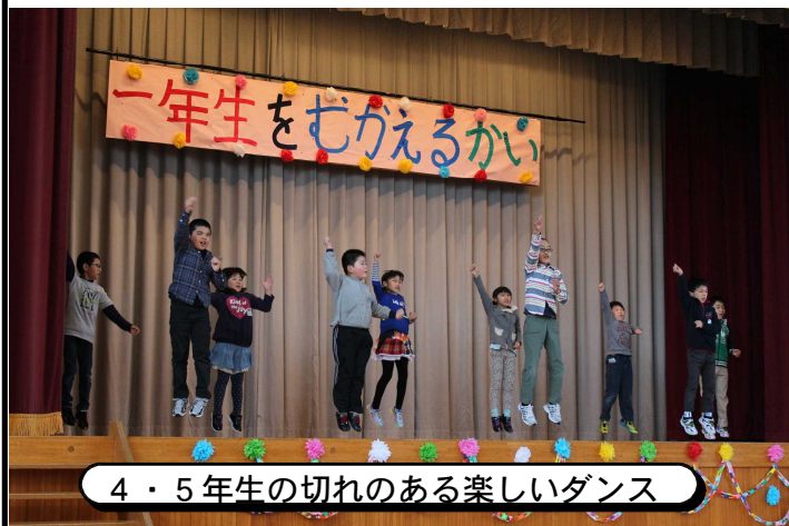
4・5年生の切れのある楽しいダンス

“笑顔と楽しさいっぱい の田井小学校” にふさわしい心温まる 素敵な会となりました。