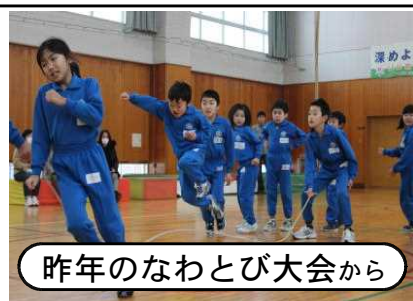
昨年のなわとび大会から

※来週20日から学校でのスキー授業がスタートです。 グラウンドにもっともっと雪がほしいものです!