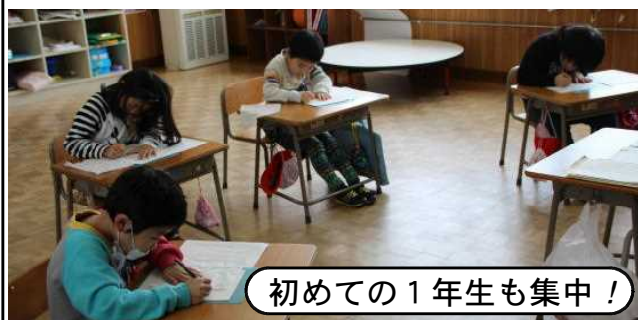
初めての1年生も集中!

これらの作品は、14日(木)から22日(金)まで“校内書き初め展”として各教室の廊下に展示してあります。どうぞご覧いただきたいと思います。