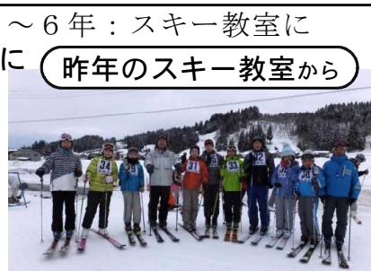
昨年のスキー教室から

※全校での須原へのスキー教室は、昨年は悪天候のため実施できませんでした。 今年は、ぜひ、実施したいと願っています。