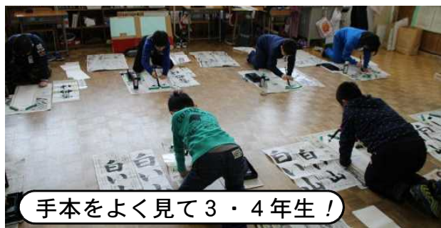
手本をよく見て3・4年生!