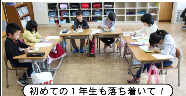
初めての1年生も落ち着いて!

作品は「新春市民書初め展(1/28~2/5 ネーブルみつけ)」に全員が出品しました。ぜひ、ご覧いただきたいと思います。