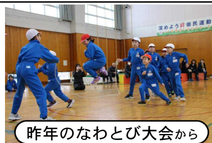
昨年のなわとび大会から