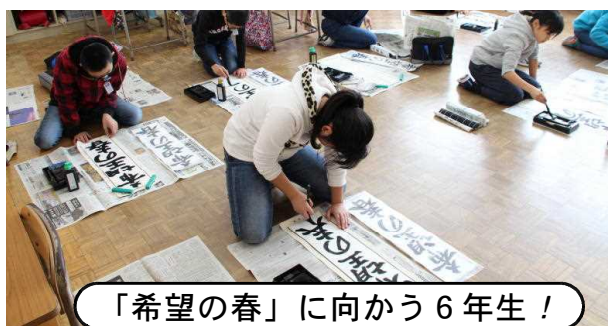
「希望の春」に向かう6年生!