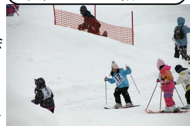
昨年のスキー教室から

※スキー教室で、子どもたちにスキーを教えてください方を募集しています。よろしくお願いたします。