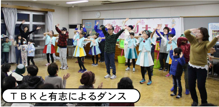
T B Kと有志によるダンス

雪解けや前日の雨でグラウンドの積雪が心配されましたが、当日はちょうどよい条件で、大勢の皆様からお越しいただき、ランチルームでの催しやグラウンドでの幻想的な“雪あかり”“花火”を地域の皆で楽しむ素晴らしい一日となりました。