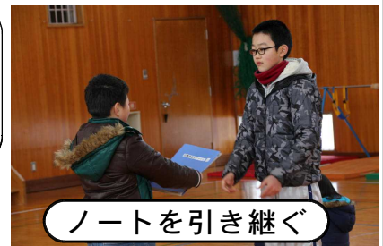
ノートを引き継ぐ

みんながたくさん本を読んで、読書が楽しいと思ってくれるよう、いろいろなイベントを考えます。また、図書室をきれいにし、大勢のみんなが図書室に来てくれるようにしたいです。(図書委員会)