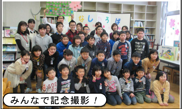
みんなで記念撮影!

終了後、たいへんお世話になったことへの感謝の気持ちとして、全員のメッセージを一枚に貼り合わせた寄せ書きをプレゼントしました。そして、最後に全員での記念撮影を行いました。