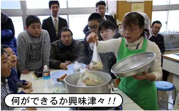
何ができるか興味津々!!

防災に対する意識と備えを高め、次回は実際に自分たちで調理する活動へと発展させたいと思います。