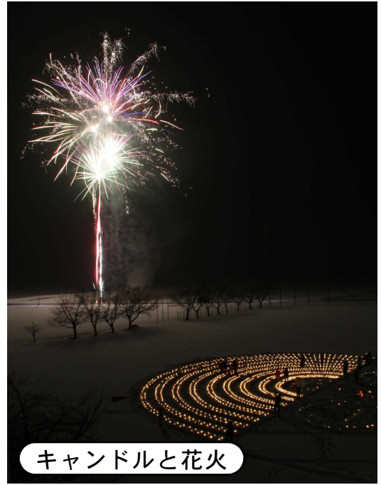
キャンドルと花火